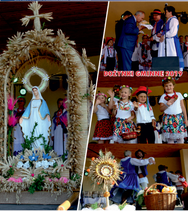
DOŻYNKI GMINNE 2019