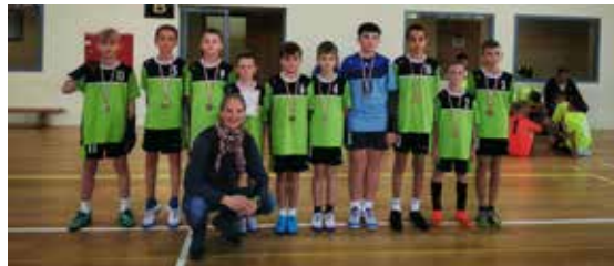
Fot. Arch. ZSP nr 1