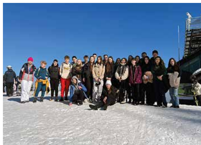
fol. Archiwum Parafii