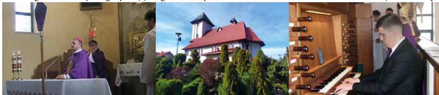
fol. Archiwum Parafii