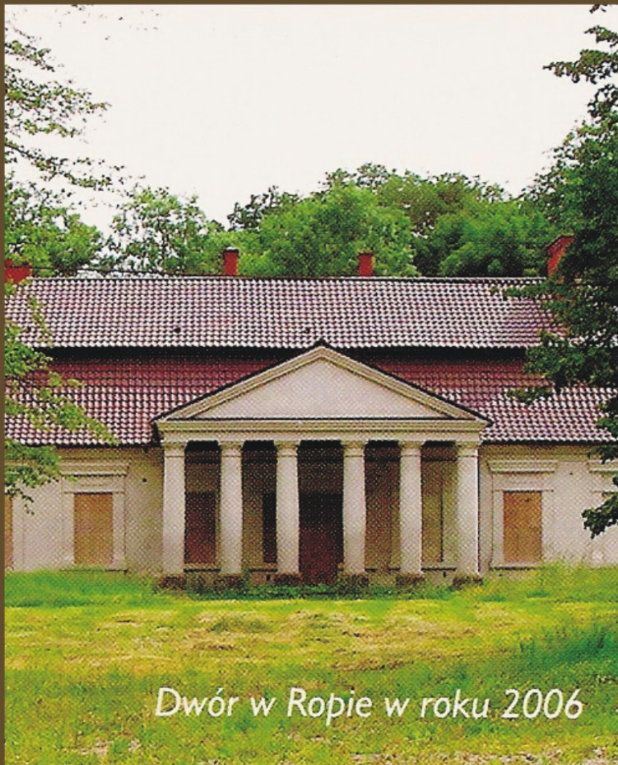
Dwór w Ropie w roku 2006