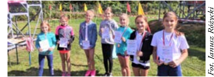
Fot. Janusz Różycki